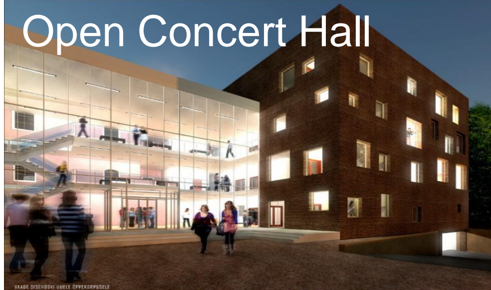
VAADE SISCHOODVI GULELT, EPPEKORPUSOLE